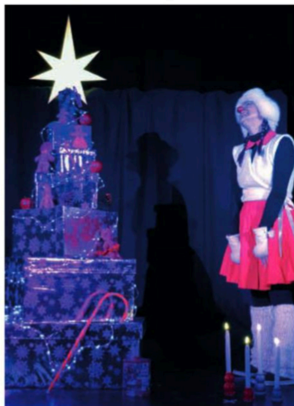
En haut : Chiffon En bas, à gauche : Tout compte fait En bas, à droite : Un clown de Noël